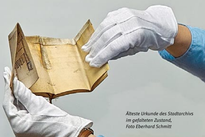
Älteste Urkunde des Stadtarchivs im gefalteten Zustand