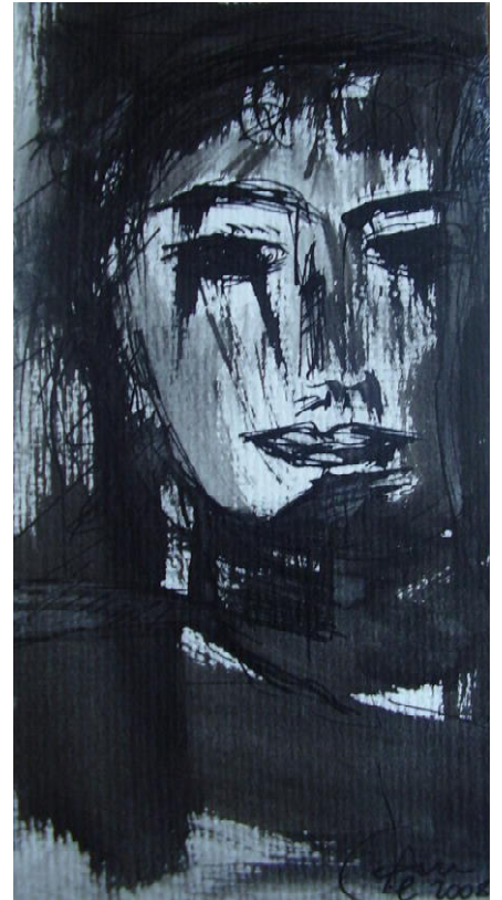
„Frau“ - Gemälde/ Bild v. Angelika Marschall, Remagen (mit freundlicher Genehmigung)

Mittwoch, 21. Nov., 17.00 Uhr: Ökumenischer Gottesdienst am Buß- und Betttag, Bartholomäus-Kirche, Kirchplatz