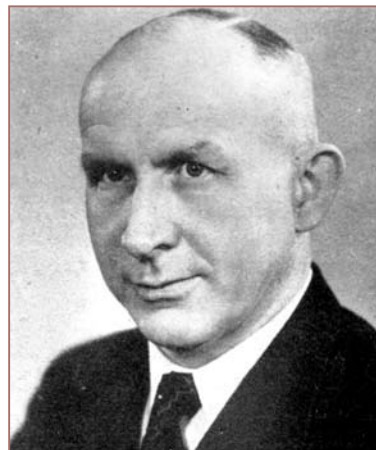
Dr. Anton Tinnes war von 1946 bis 1948 der erste gewählte Bürgermeister der Stadt Vöcklingen nach dem Zweiten Weltkrieg.

errichtet worden (ABl. der Verwaltungskommission des Saarlandes Nr. 49, 1946, S. 205-206).