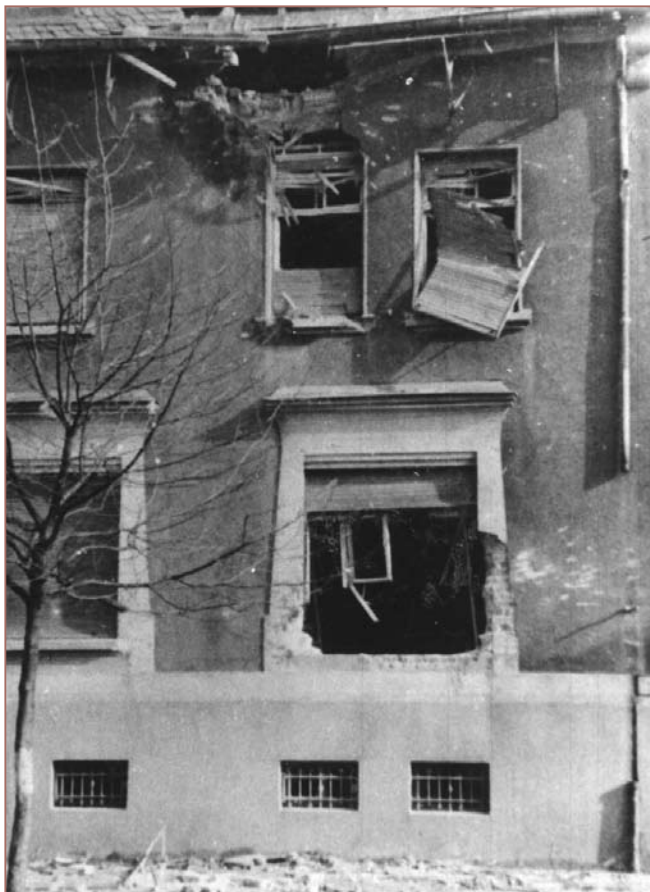
Vöcklingen nach Kriegsende: Zerschossene Häuserfassade in der Bismarckstraße.

Dabei wird an dieser Stelle wieder allen Unterstützern gedankt, die das Entstehen dieses Heftes möglich gemacht haben. Insbesondere wird dabei Dr. Jens Heckl und Petra Becker M.A. für die Textrevision sowie Horst Kunkel für die Überlassung seines Bildarchivs gedankt. Ausdrücklich soll hier einmal allen Kolleginnen und Kollegen in den saarländischen Archiven gedankt werden, die mit ihren Informationen ebenfalls zum Gelingen dieser Ausgabe beigetragen haben.