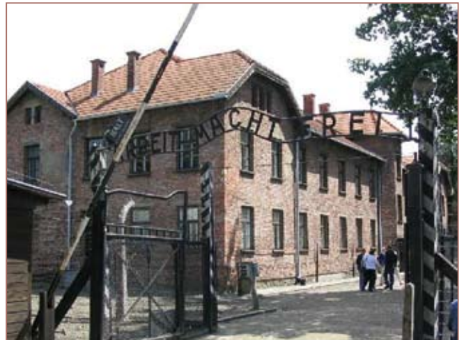
Eingang zum Konzentrationslager Auschwitz.